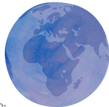
Illustration: Ida Brogren för projekt Barn i familj.

Därför är det viktigt att möta dem med särskild förståelse för deras situation och behov. 3